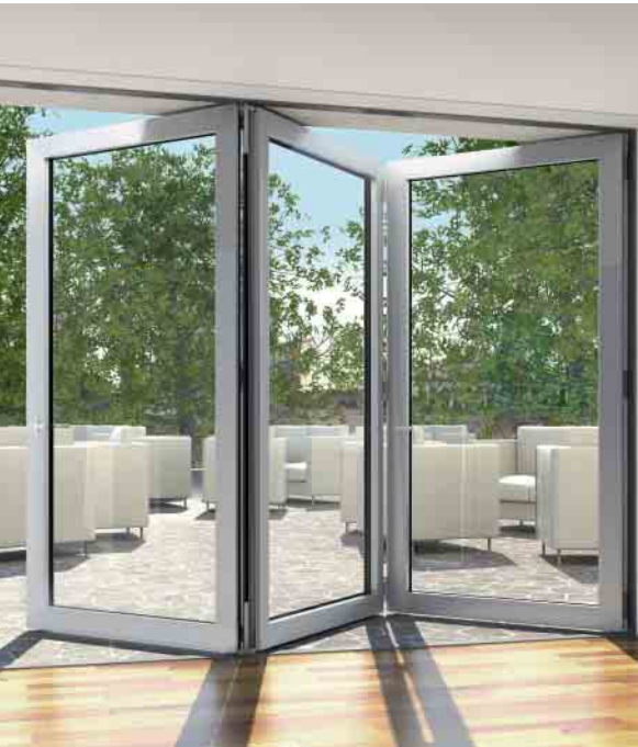
Schüco ASS 70 FD – wärmegeädämmtes Faltschiebesystem Schüco ASS 70 FD – thermally insulated folding sliding system