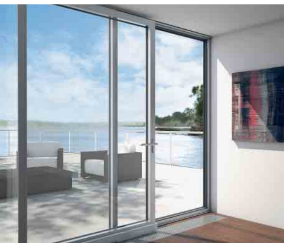
PASK-Fenstertüren bieten variable Lüftungsmöglichkeiten Tilt / slide window doors offer the best possible ventilation options

The non-insulated folding sliding door is the ideal choice in areas where no additional thermal insulation is required. The door system can be opened fully to extend offices, business rooms and living areas.